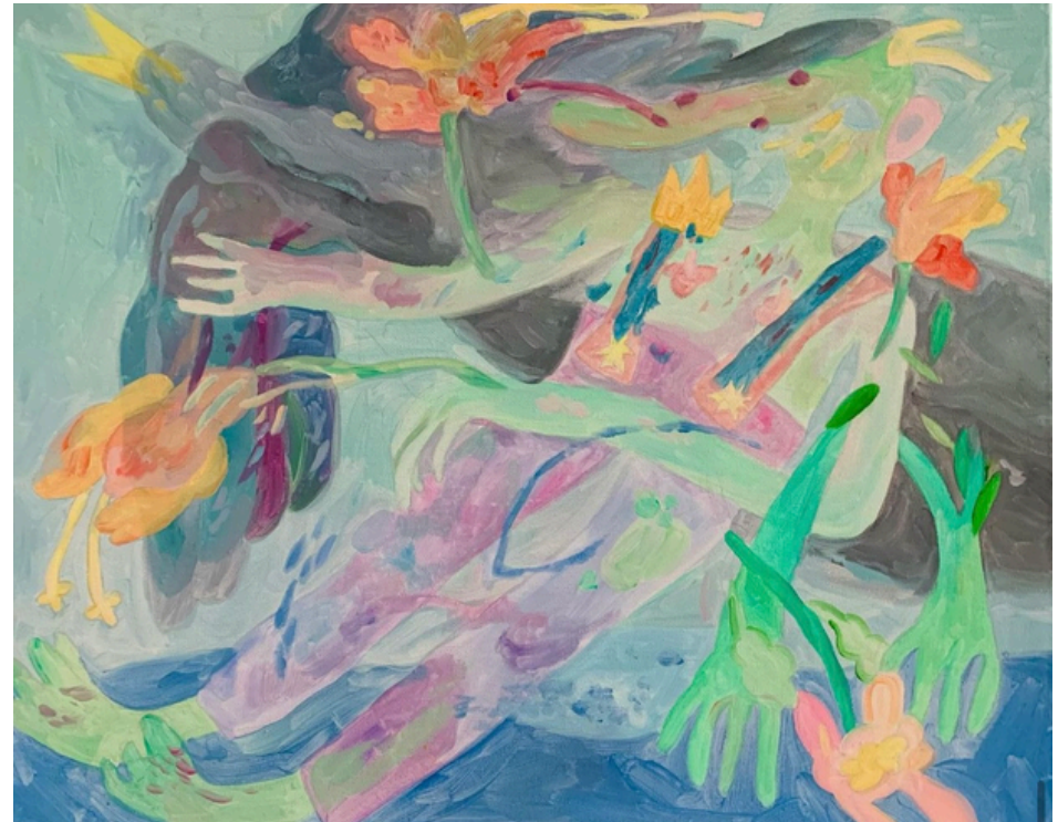
TrunkMan - Histoire triste récente Acrylique sur toile 40 x 50 cm 2023 250 euros