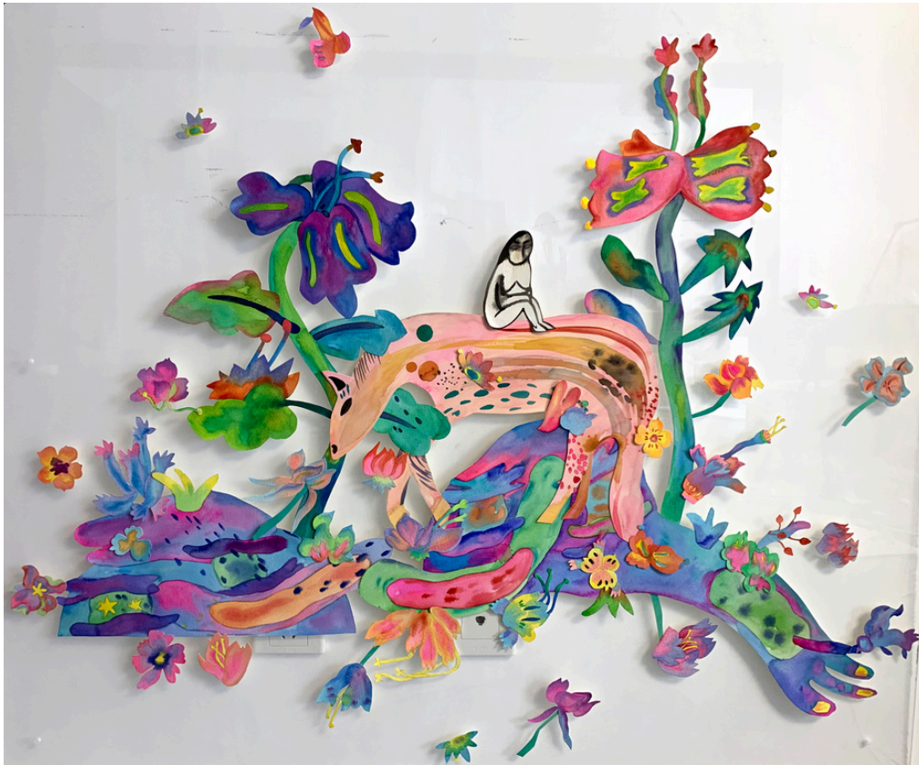
TrunkMan-planète rose-A71 Aquarelle sur papier 100 x110 cm 2024 700 euros

Exposition Solo de CICI « TrunkMan » 2-15 septembre 2024