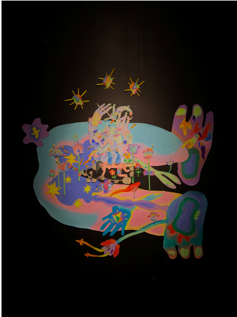
TrunkMan-planète rose-A45 Aquarelle sur papier, acrylique sur toile 140 x150 cm 2024 1200 euros