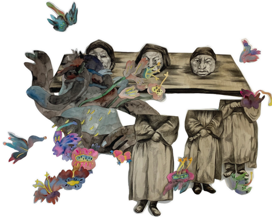
TrunkMan-planète noire-A76 Aquarelle et fusain sur papier 90 x110 cm 2024 600 euros

Exposition Solo de CICI « TrunkMan » 2-15 septembre 2024