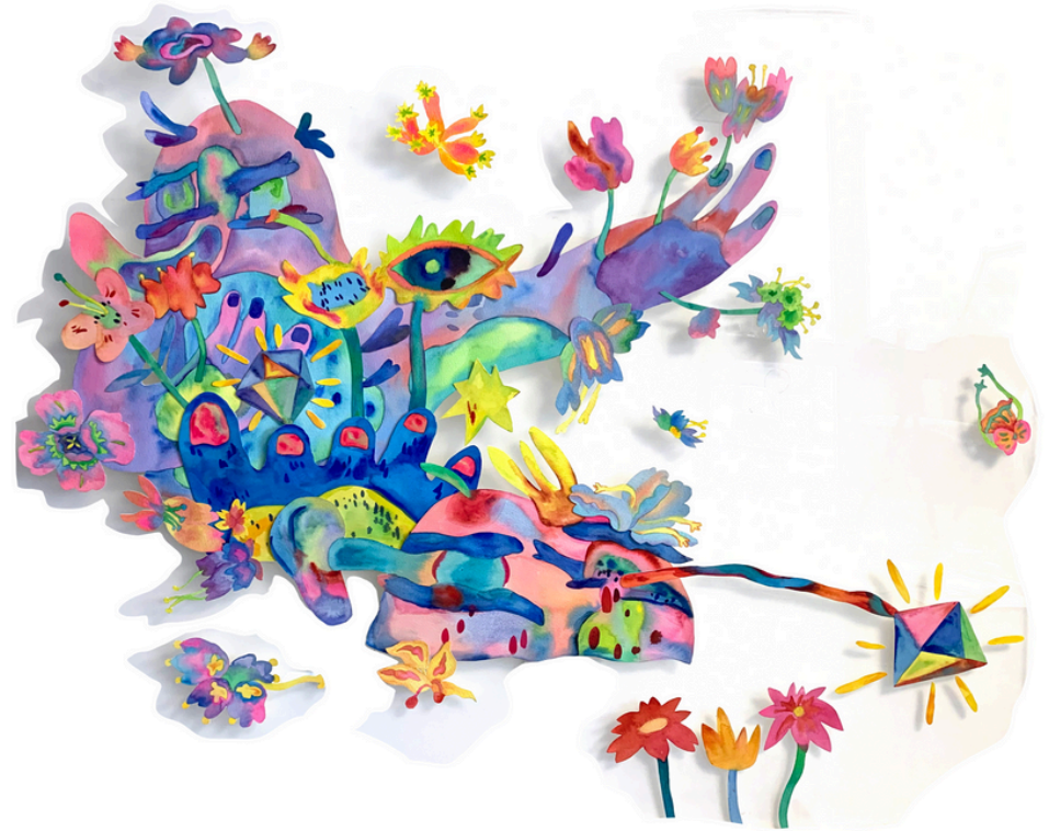
TrunkMan-planète rose-A63 Aquarelle sur papier 90 x110 cm 2024 600 euros