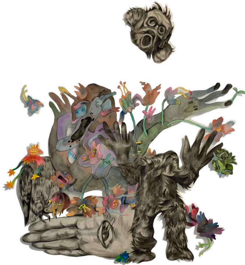
TrunkMan-planète noire-A89 Aquarelle et fusain sur papier 100 x110 cm 2024 700 euros

Exposition Solo de CICI « TrunkMan » 2-15 septembre 2024