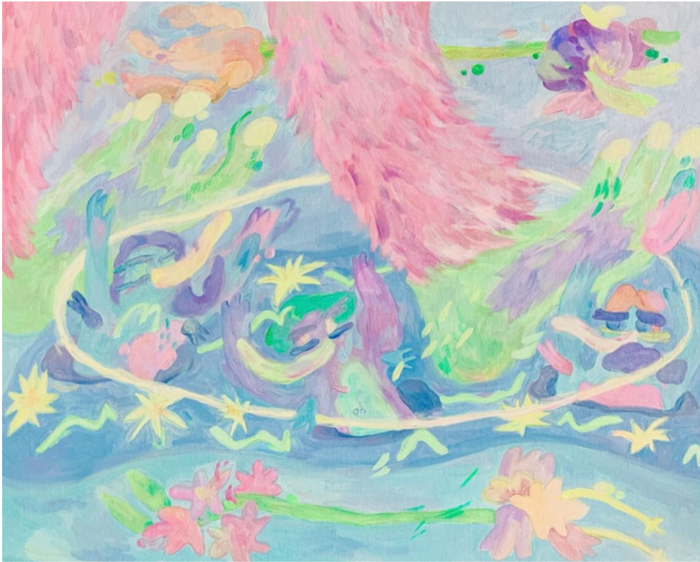
TrunkMan - Mon ombre lumineuse Acrylique sur toile 40 x 50 cm 2023 250 euros

Exposition Solo de CICI « TrunkMan » 2-15 septembre 2024