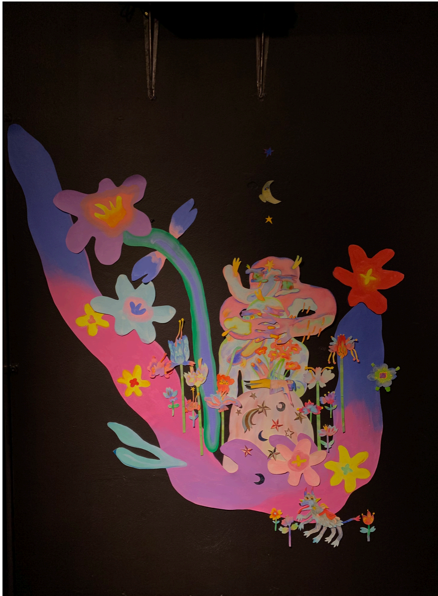
TrunkMan-planète rose-A39 Aquarelle sur papier, acrylique sur toile 100 x110 cm 2024 1100 euros