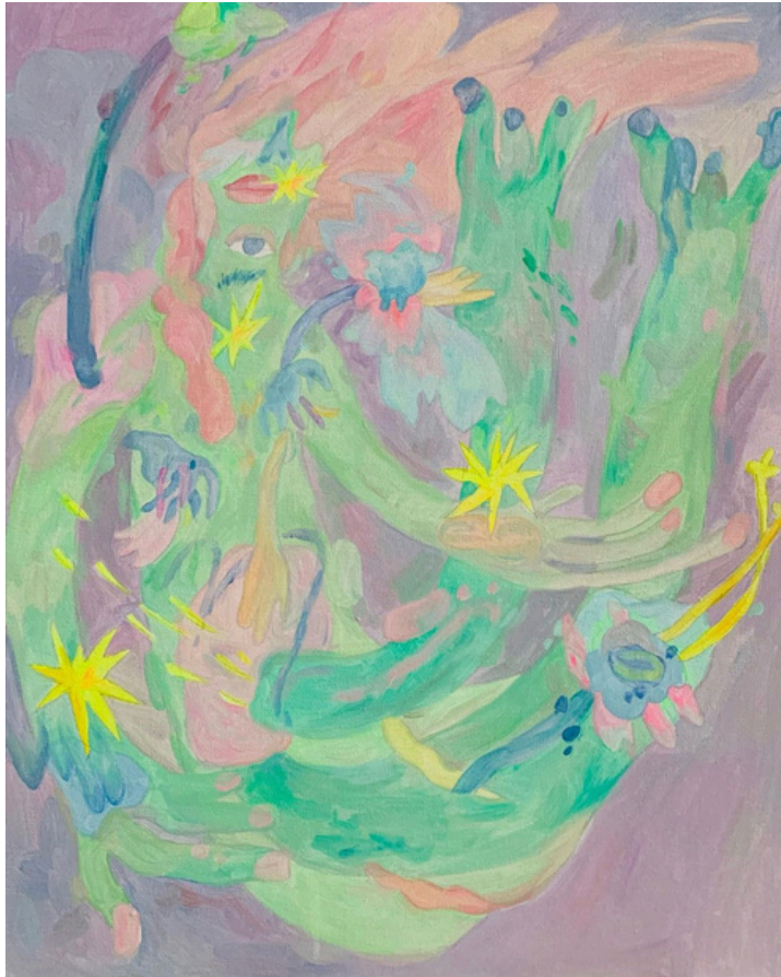
TrunkMan - Tous les secrets se trouvent dans les jours venteux Acrylique sur toile 40 x 50 cm 2023 250 euros

Exposition Solo de CICI « TrunkMan » 2-15 septembre 2024