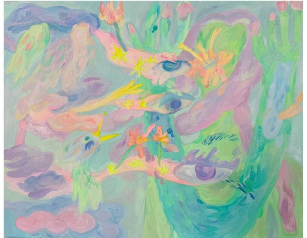
TrunkMan-graines de pluie Acrylique sur toile 40 x 50cm 2023 250 euros