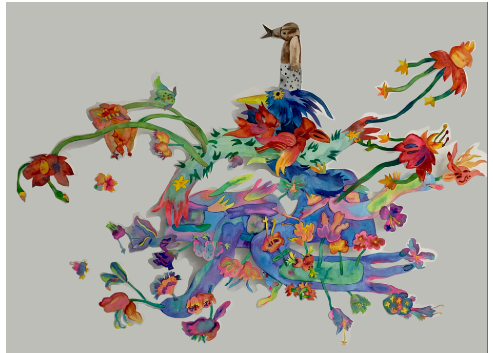
TrunkMan-planète rose-A36 Aquarelle sur papier 130 x 110 cm 2024 800 euros