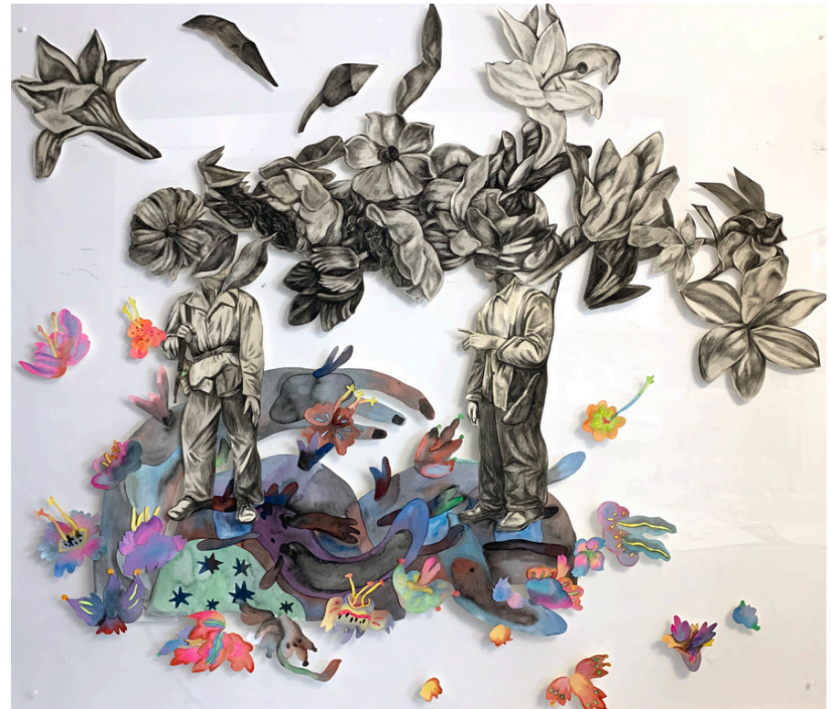
TrunkMan-planète noire-A87 Aquarelle et fusain sur papier 130 x110 cm 2024 800 euros