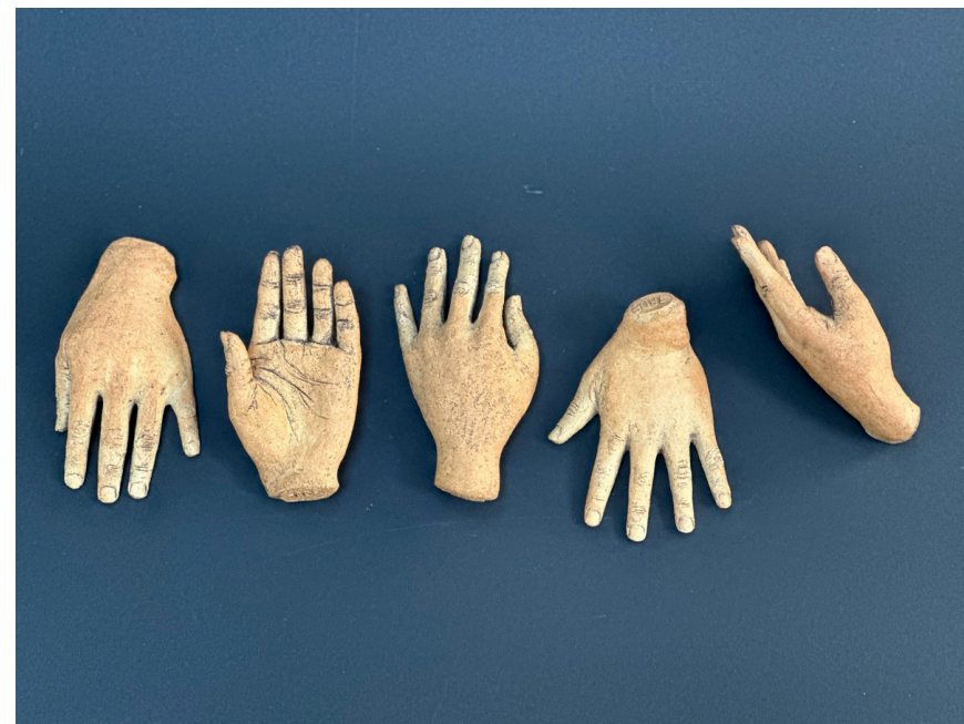
Série "Les mains " Grès et oxydes cuisson 1260°