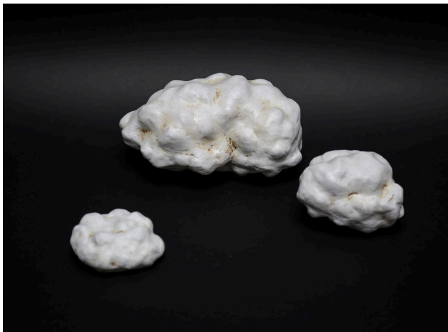
Série "nuages " Grès, oxydes et jus de porcelaine cuisson 1260°