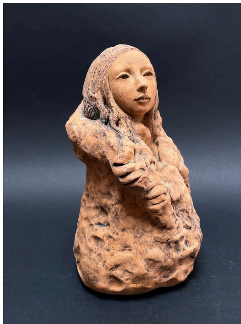
Le manteau de laine Grès et oxydes cuisson 1260°