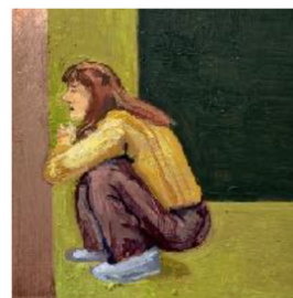
Marlène Acrylique sur cuivre 5 x 5cm, 2023