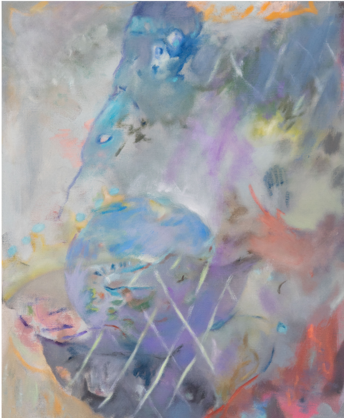
Sans titre - Thomas AURIOL Huile sur toile 46 x 38cm, 2023