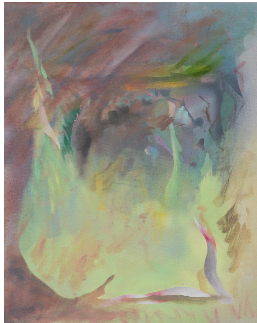
Sans titre - Thomas AURIOL Huile sur toile 50 x 40cm, 2023