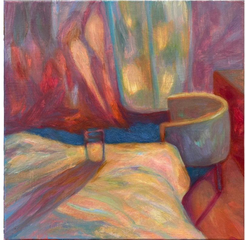
Soit soif - Tzumin TSAI Tempera à l'œuf 25 x 25cm, 2023