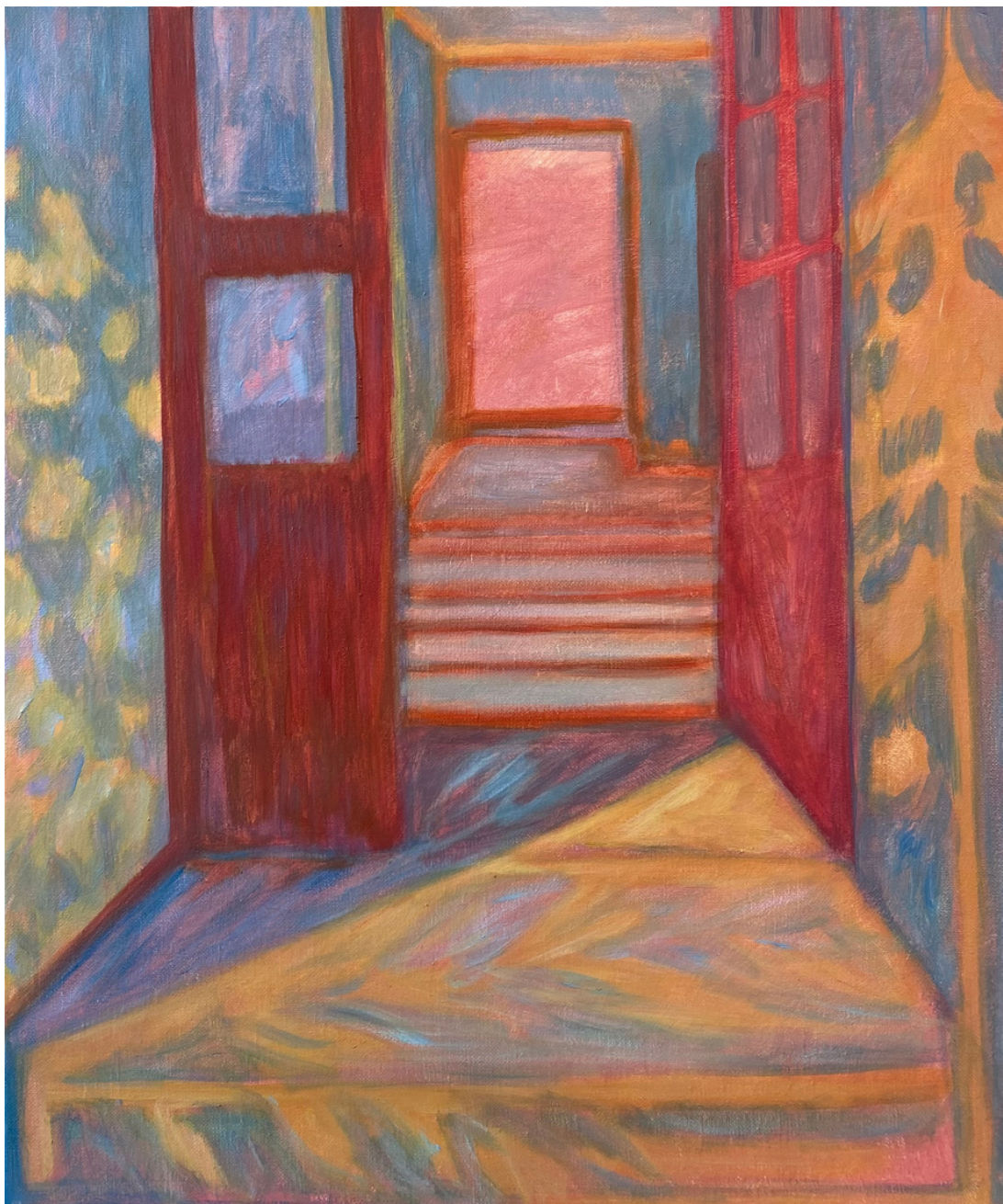
Sun Layer - Tzumin TSAI Tempera à l'œuf 55 x 46cm, 2024