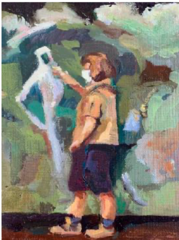
Drawing Class Huile sur toile 19 x 26cm, 2022