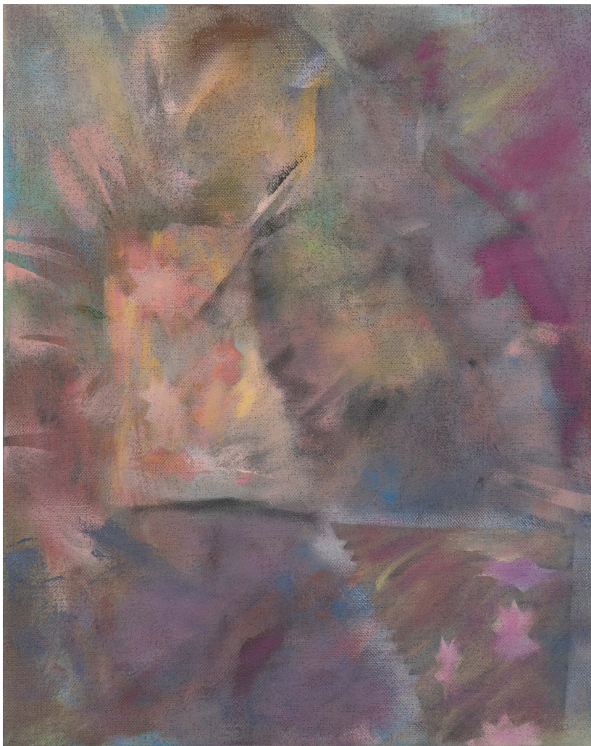
Sans titre - Thomas AURIOL Huile sur toile 33 x 24cm, 2023