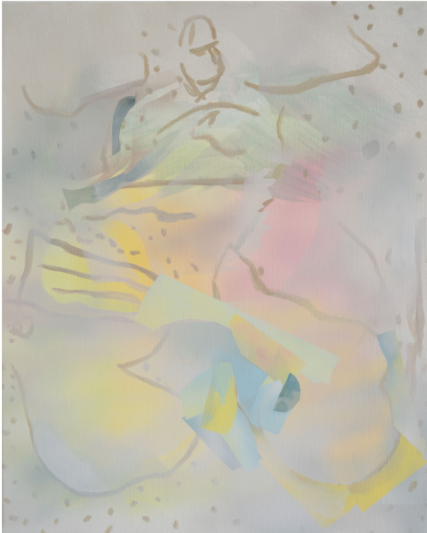
Sans titre - Thomas AURIOL Acrylique et aérographe sur toile 50 x 40cm, 2020