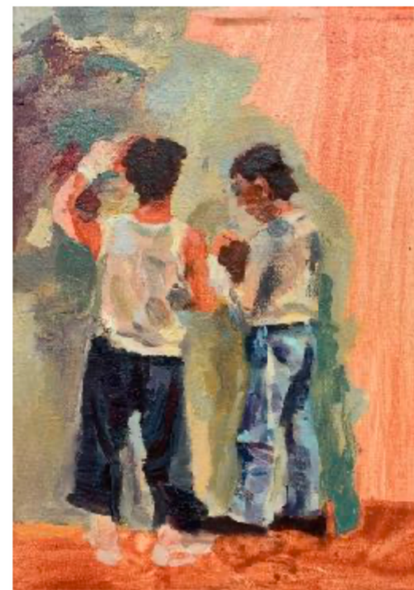
Builders I Huile sur toile 18 x 24cm, 2022