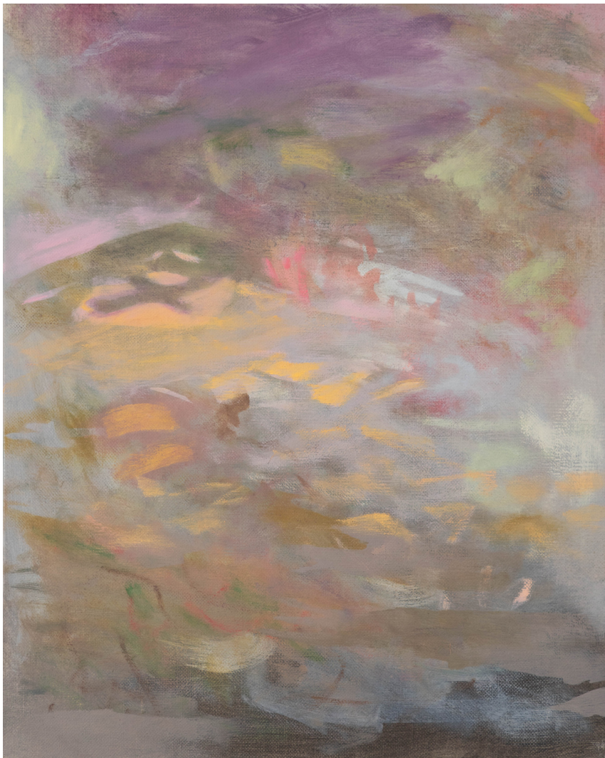
Sans titre - Thomas AURIOL Huile sur toile 41 x 33cm, 2023