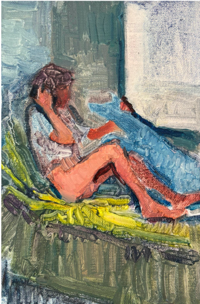
Souvenir, jeune homme au téléphone - Timothée GRUEL