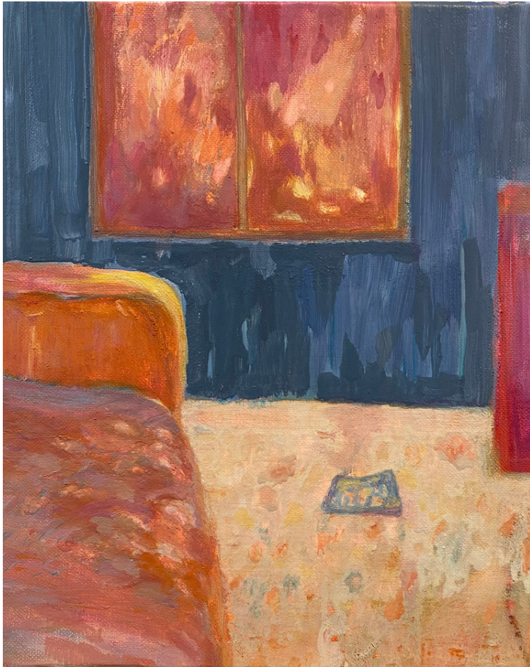
Lettre W - Tzumin TSAI Tempera à l'œuf 24 x 30cm, 2023