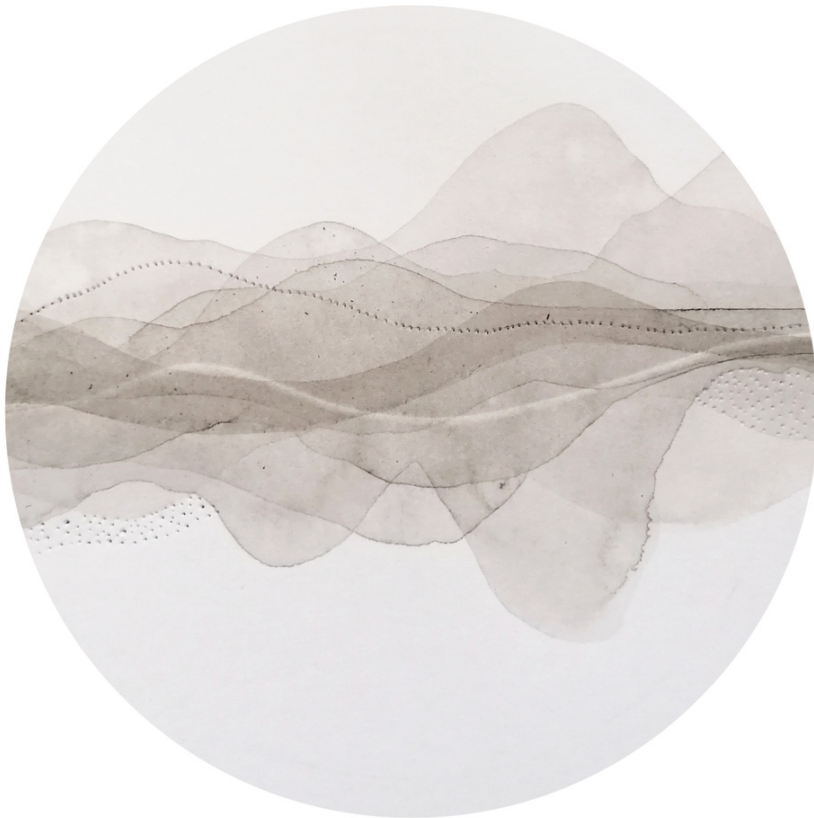
Traces de douceur Peinture à l'encre de Chine 12x12 CM, 2023

"Au-delà de l'Encre" n'est pas simplement une exposition, mais une quête intérieure, un dialogue entre l'héritage millénaire de la peinture à l'encre et les frontières de l'innovation artistique. Les œuvres de Biru Zhao, imprégnées de son essence singulière, ouvrent des portes vers l'inconnu, chaque coup de pinceau dévoilant une parcelle de vérité universelle.