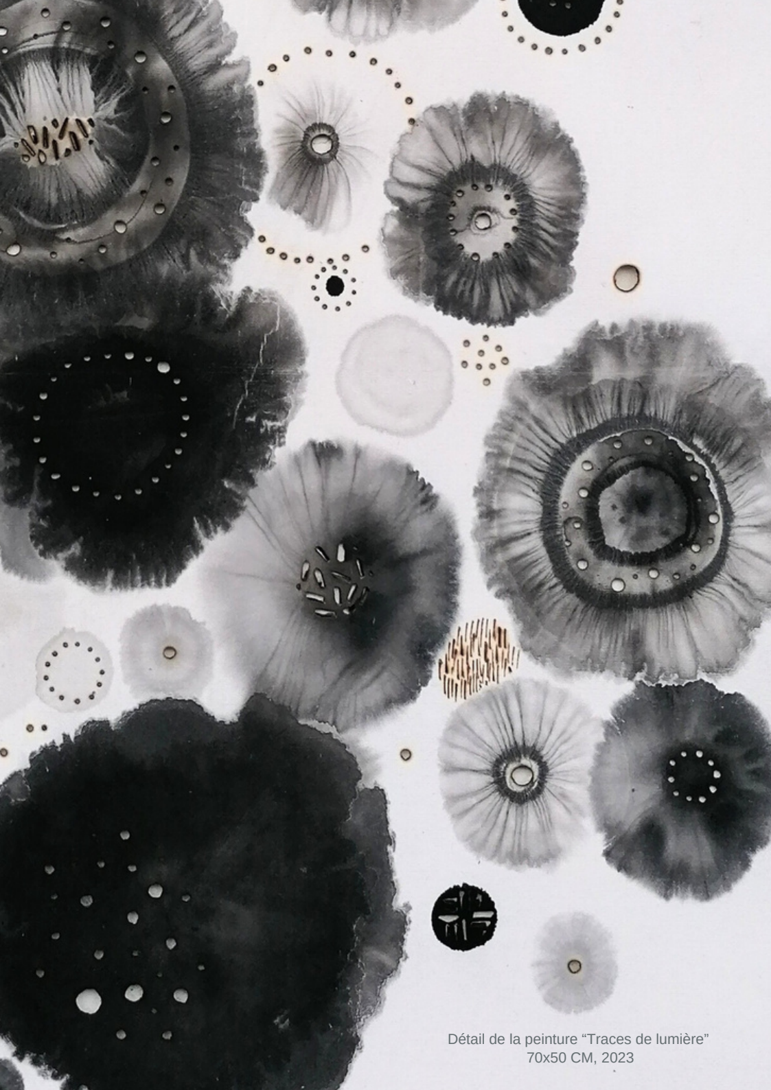
Détail de la peinture "Traces de lumière" 70x50 CM, 2023

Institut Confucius de Bretagne et LooLooLook Gallery ont le plaisir de vous convier au vernissage et à l'exposition de