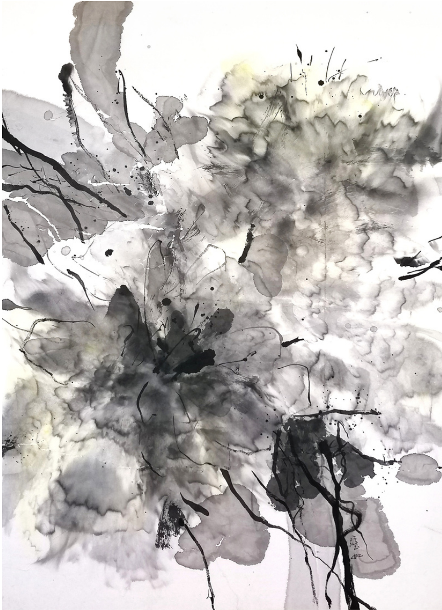
Danse Peinture à l'encre de Chine 65x50 CM, 2023